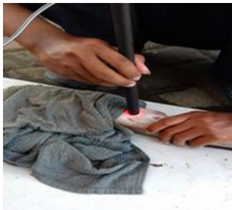
Gambar 18. Induksi laserpunktur di titik reproduksi dan kepala dan sebagian badan induk lele ditutup dengan haduk basah