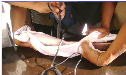
Gambar 11. Cara induksi laserpunktur di titik reproduksi pada ikan lele