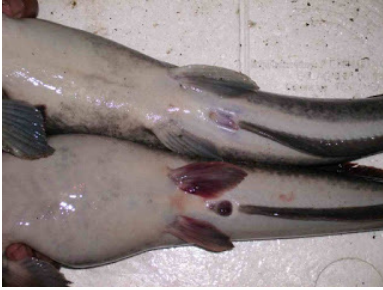
Gambar 5. Gonad induk lele matang