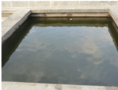
Gambar 13. Kolam induk lele