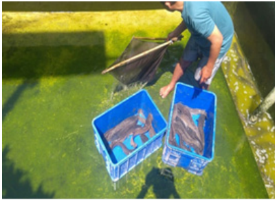
Gambar 14. Pengesatan kolam untuk mengambil induk lele