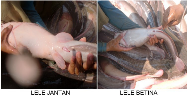
Gambar 1. Kondisi induk lele jantan dan betina matang gonad siap untuk dipijahkan