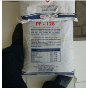
Gambar 16. Pakan khusus untuk induk lele