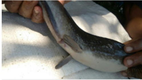
Gambar 17. Pengamatan porus genitalis setiap induk lele lele