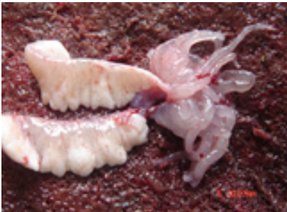
Gambar 7. Gonad lele jantan induksi laserpunktur matang gonad