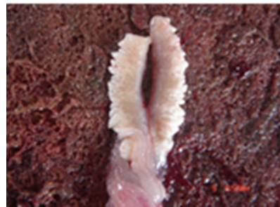
Gambar 8. Gonad lele jantan kelompok kontrol matang gonad

Penentuan TKG dapat dipakai sebagai dasar untuk menentukan kondisi induk lele bilamana akan memijah, baru memijah atau sudah memijah. Perkembangan gonad dapat ditentukan dengan melihat nilai GSI (Rao and Krishnan, 2009). Nilai GSI digunakan untuk menentukan kondisi keseluruhan ikan. GSI ini sering digunakan untuk menentukan TKG karena penggunaan dan penentuannya sangat mudah (van Dyk, 2006).