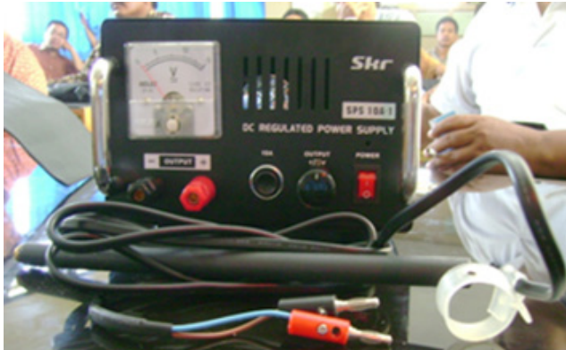
Gambar 4. Satu unit laserpunktur (Kusuma, 2000).

dilakukan pada induk lele yang pertama kali memijah, namun titik induksi lasernya berbeda dengan ikan nila yaitu di titik reproduksi pada induk lele jantan tepatnya di 2/3 bagian ventral tubuh selama 15 detik adalah yang optimal untuk merangsang potensi reproduksi dari gonad lele. Salah satu indikator pematangan gonad adalah GSI. Induk lele baik betina maupun jantan yang diinduksi laserpunktur nilai GSI-nya lebih tinggi dibandingkan dengan yang tanpa diinduksi laserpunktur (Hariani, 2015, Hariani et al. , 2018; Kusuma et al. , 2018). Hal ini merupakan pembuktian bahwa aktivitas seluler terjadi pada titik reproduksi yang diinduksi oleh laserpunktur (Pryor, 2011).