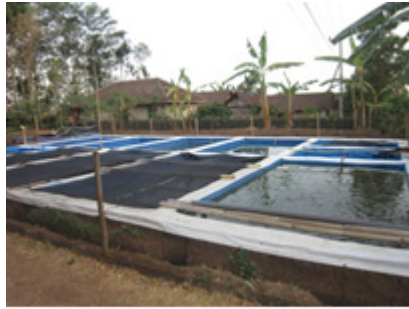
Gambar 19. Kolam pemijahan, setelah induk memijah dan pengambilan induk. Telur menetas menjadi larva yang dipelihara dalam kolam tersebut