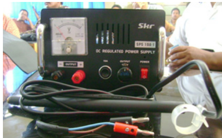
Gambar 9. Power laserpunktur laserpunktur