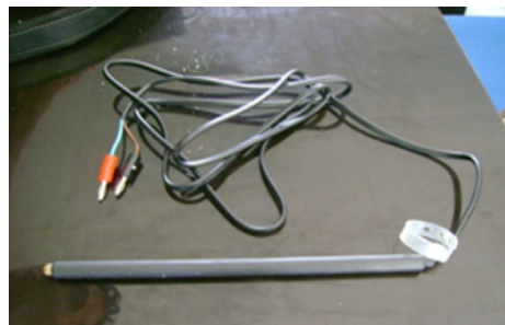
Gambar 10. Probe laserpunktur