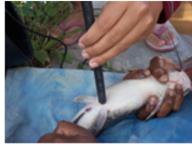
Gambar 6. Induk lele diinduksi laser