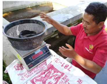
Gambar 15. Penimbangan induk lele mengambil induk lele